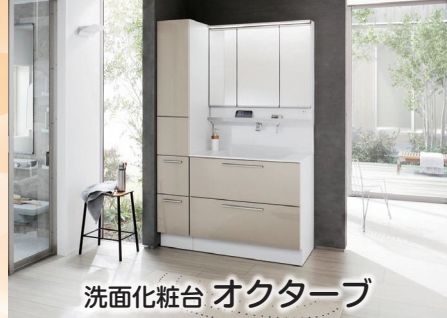
洗面化粧台 オクターブ