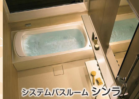
システムバスルーム シンラ