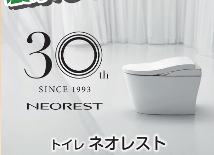
トイレ ネオレスト