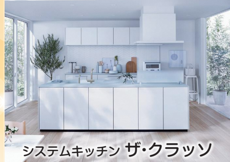
システムキッチン ザ・クラツソ